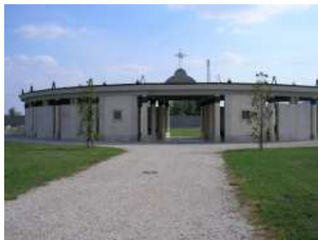
La rotonda ed uno scorcio delle tombe già esistenti