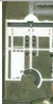
Cimitero nuovissimo con la rotonda delle nuove tombe